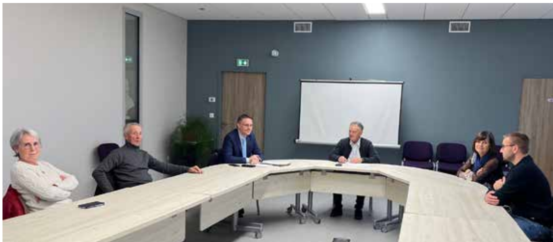
Table ronde à la mairie de Meauzac avec Monsieur le Sous-préfet, Monsieur le Maire et ses adjoints

L E VENDREDI 1 er DÉCEMBRE après-midi, Monsieur le Sous-Préfet de l'arrondissement de Castelsarrasin a répondu à notre invitation.