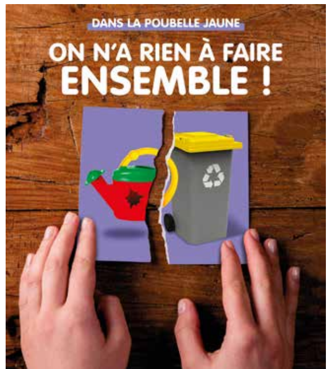
Les objets en plastique , c'est à la déchèterie