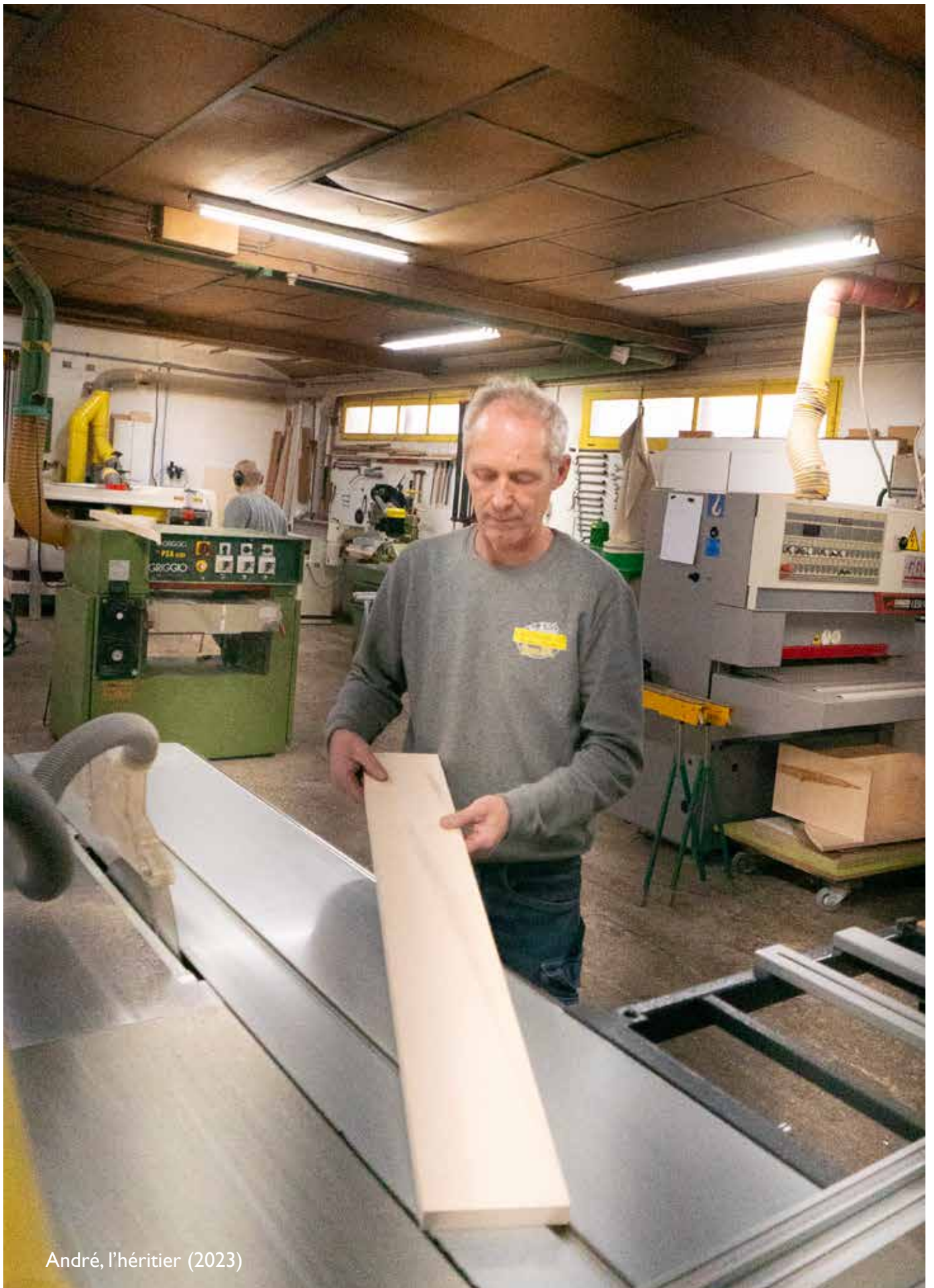
André, l'héritier (2023)