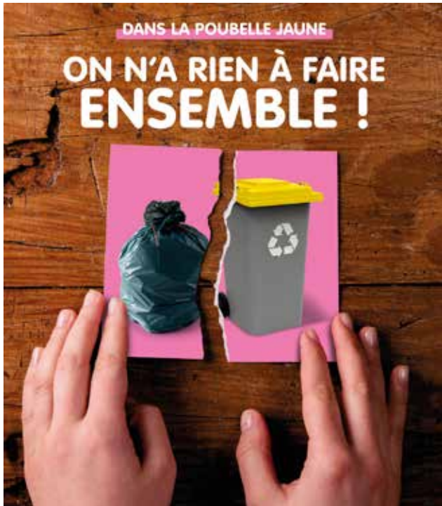
Les sacs opaques , c'est dans le bac (gris) des ordures ménagères