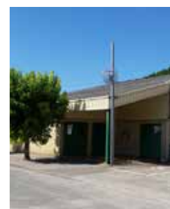
Entrée Salle des fêtes