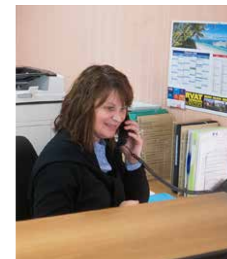
... avec toujours un sourire à l'accueil.