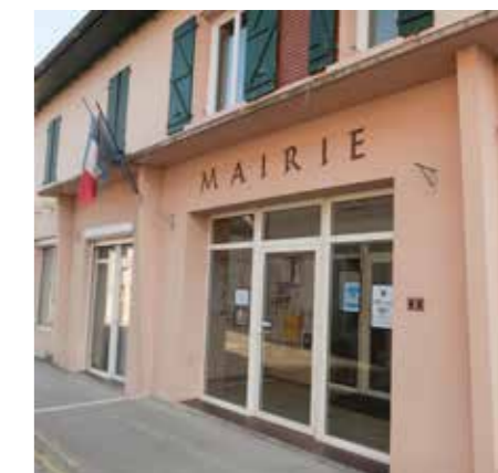
L'entrée de la Mairie de Meauzac...