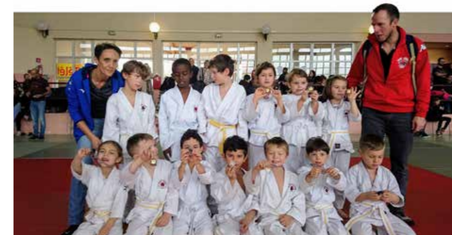
Les mini-poussins au tournoi interclubs de Bressols

Tous les membres du TRT Judo 82 vous souhaitent de bonnes fêtes de fin d'année et, avec un peu d'avance, vous présentent leurs meilleurs vœux pour 2020 !