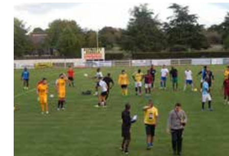
JSM à l'entraînement

Au nom de tous les membres du bureau de la JSM, je vous souhaite de passer d'excellentes fêtes de fin d'année.